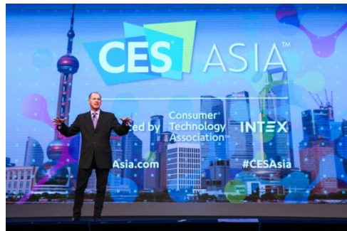
美国消费技术协会总裁兼首席执行官盖瑞·夏培罗先生在2017年亚洲消费电子展上发表开幕主题演讲