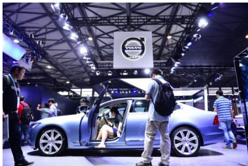
2017年亚洲消费电子展最新汽车技术