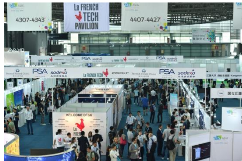
初创企业在2017年亚洲消费电子展上展示最新技术