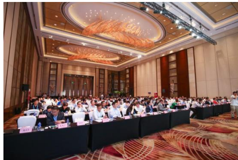
2017年亚洲消费电子展专题会议