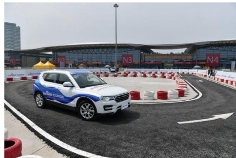
2017年亚洲消费电子展自动驾驶汽车展示