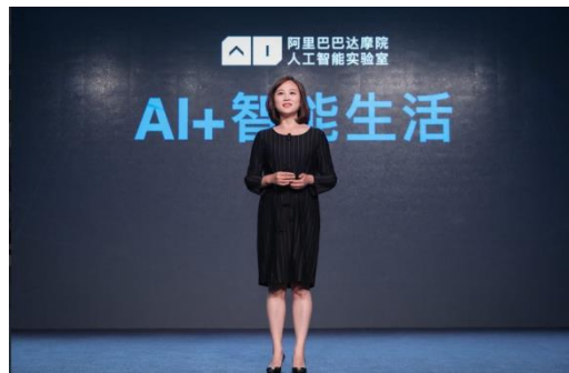
阿里巴巴人工智能实验室主题演讲