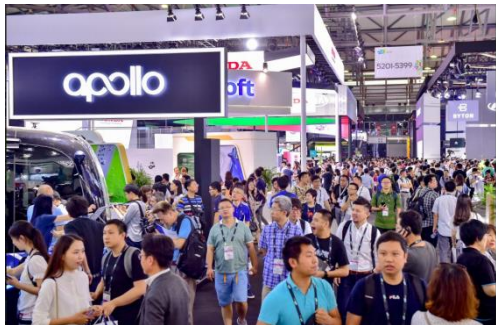
2018年亚洲消费电子展展厅人潮涌动