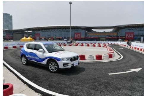
2018年亚洲消费电子展自动驾驶汽车展示